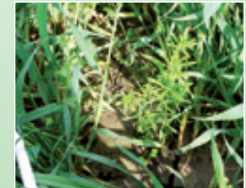
Caliban TOP mit Extrapower gegen Klettenlabkraut.