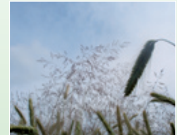
Windhalm: für Caliban Duo kein Problem