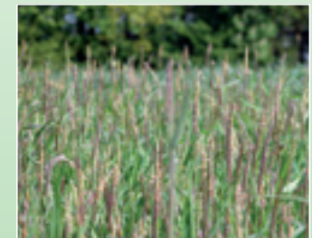
Caliban Duo mit Extrapower gegen Ackerfuchsschwanz.