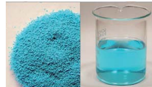
Sauber und bequem in der Anwendung: Mospilan SG

* §6.2 PflSchG und Länderregelung beachten